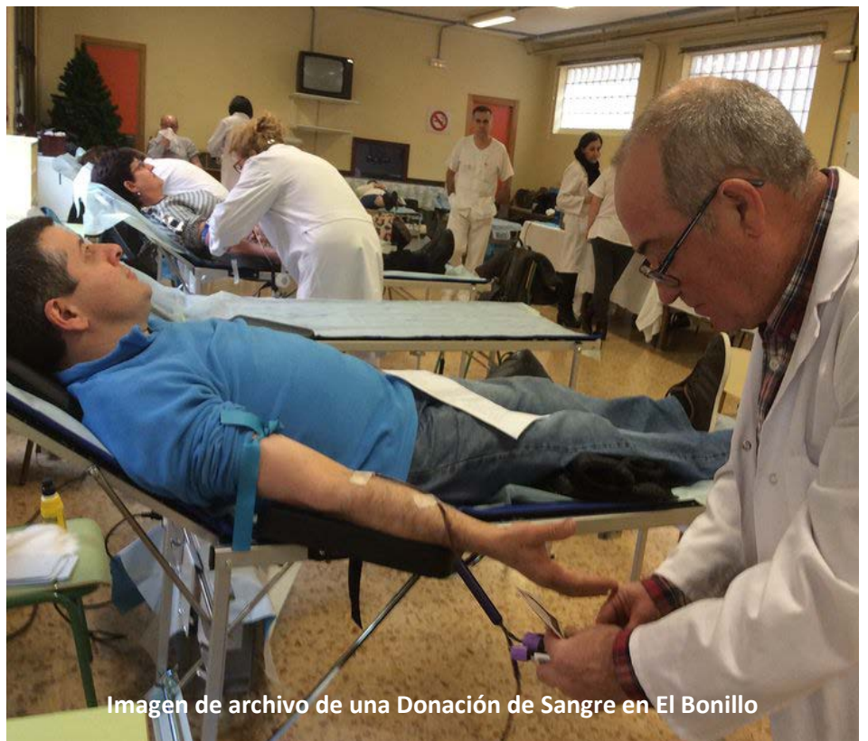
Imagen de archivo de una Donación de Sangre en El Bonillo

Esta campaña se realiza desde el año 2005 en todas aquellas poblaciones a las que la Hermandad de Donantes de Sangre y el Centro de Transfusión se desplazan para realizar colectas de sangre.