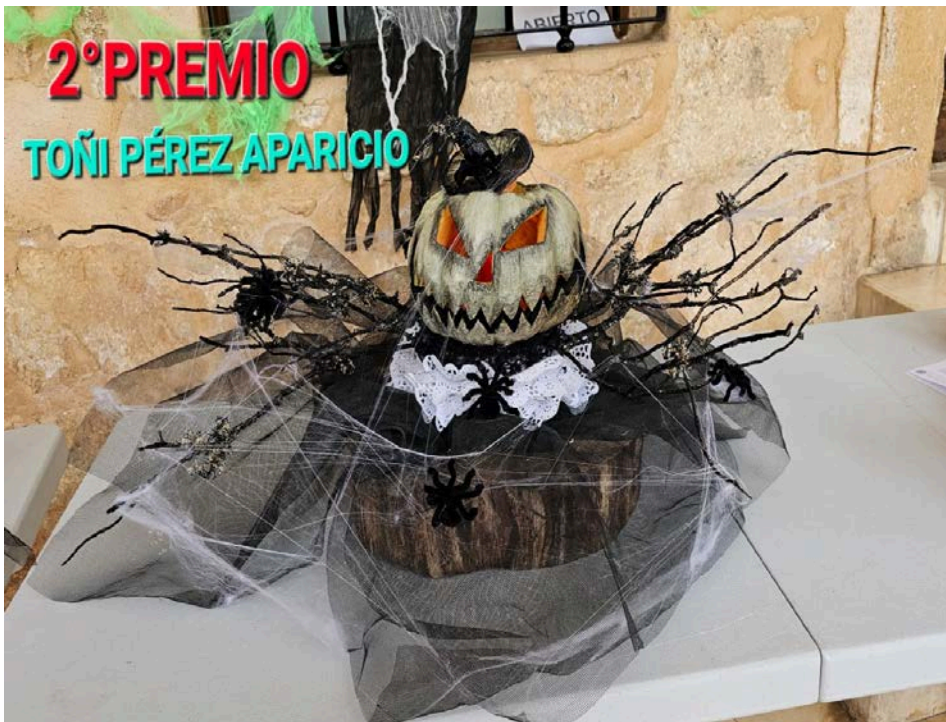
2° PREMIO TOÑI PÉREZ APARICIO