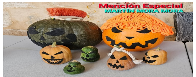
Mención Especial MARTÍN MORA MORA